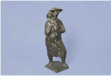
Jan Wolkers, Moeder met kind. Brons, 1953.