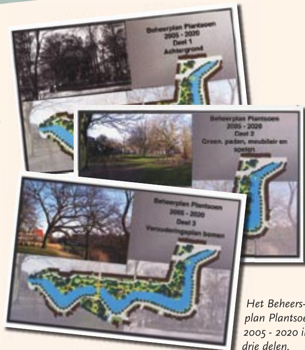
Het Beheerplan Plantsoen 2005 - 2020 in drie delen.

Recent heeft Monumentenzorg een reactie daarop gegeven, met als gevolg dat nog een paar dingen veranderd moet worden.